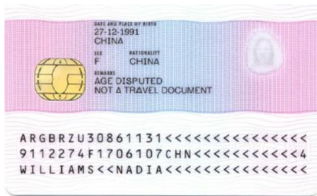
(تصویر پشت کارت)

اگر کارت ثبت درخواست شما (ARC) را در عرض مدت نسبتاً کوتاهی پس از انجام مصاحبه مقدماتی تان دریافت نکردید، از مددکار اجتماعی تان، سرپرست و قیم تان، یا از وکیل قانونی خود بخواهید که موضوع عدم دریافت را بررسی و دنبال کنند.